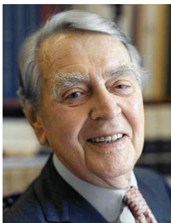
40 » » » NACHRUF: ZUM TOD VON PROF. DR. H.C. MULT. BERTHOLD BEITZ