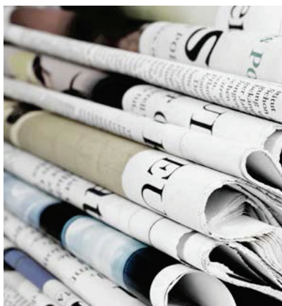
34 » » » QUALITÄTSJOURNALISMUS: AUFRUF VON STIFTUNGEN SORGT FÜR MEDIENECHO