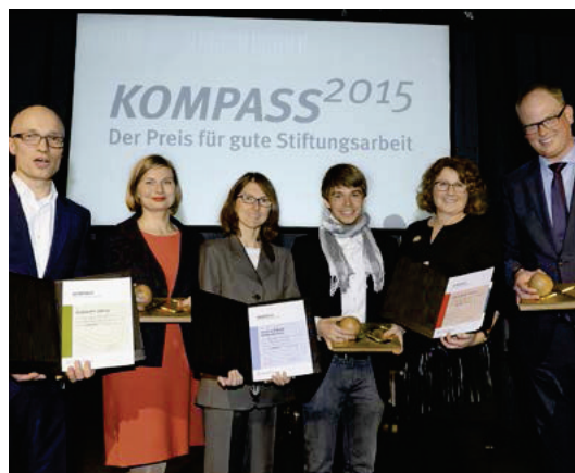
54 » » » MANAGEMENT, PROJEKTE, KOMMUNIKATION: KOMPASS 2015 FÜR GUTE STIFTUNGSARBEIT VERLIEHEN

STIFTUNGSWELT DIGITAL LESEN www.stiftungen.org/digital