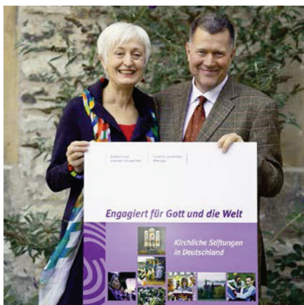
30 » » » BUCHVORSTELLUNG: DAS KIRCHLICHE STIFTUNGSWESEN IN DEUTSCHLAND